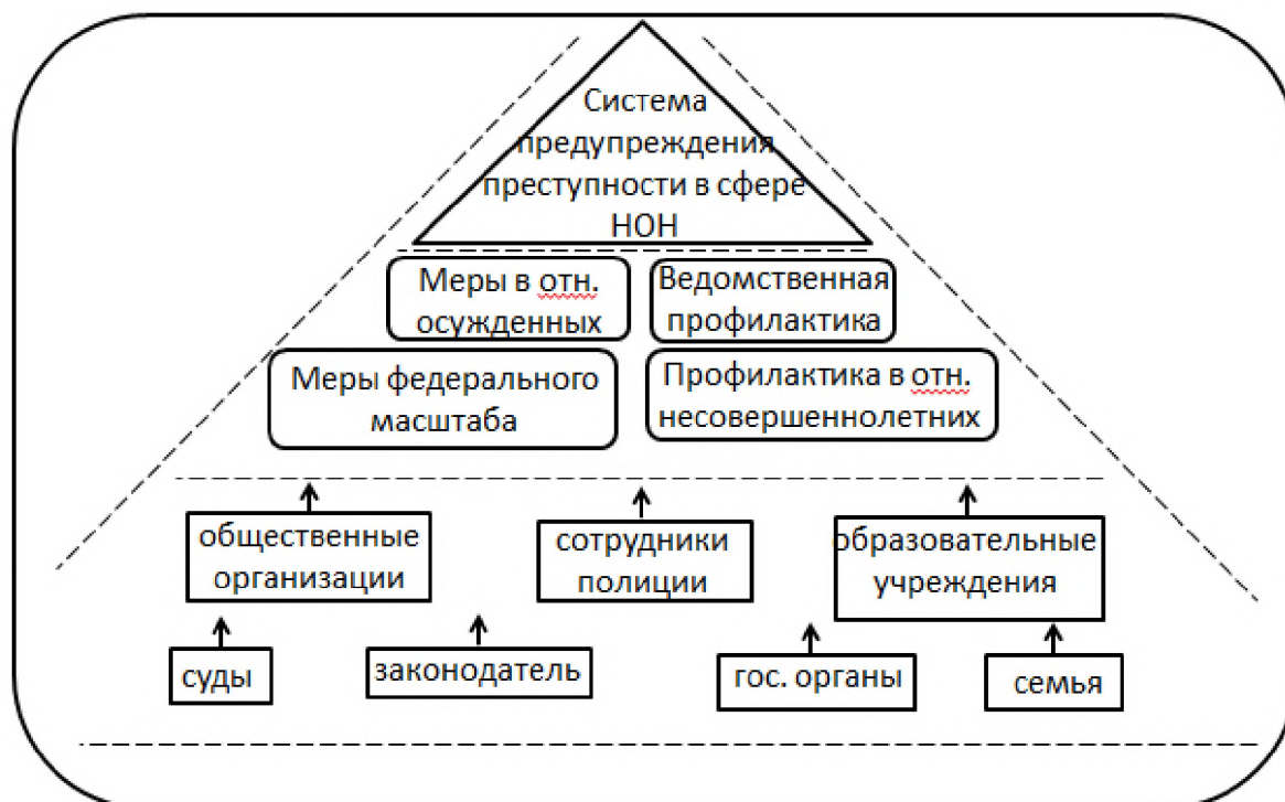
Таблица 2. Система предупреждения преступности в сфере НОН

Подводя итог параграфу, стоит отметить, что система предупреждения преступности в сфере незаконного оборота наркотиков представляет собой целостную систему, состоящую из пересекающихся элементов, каждый из которых включает комплекс профилактических мер, осуществляемых взаимосвязанными субъектами.